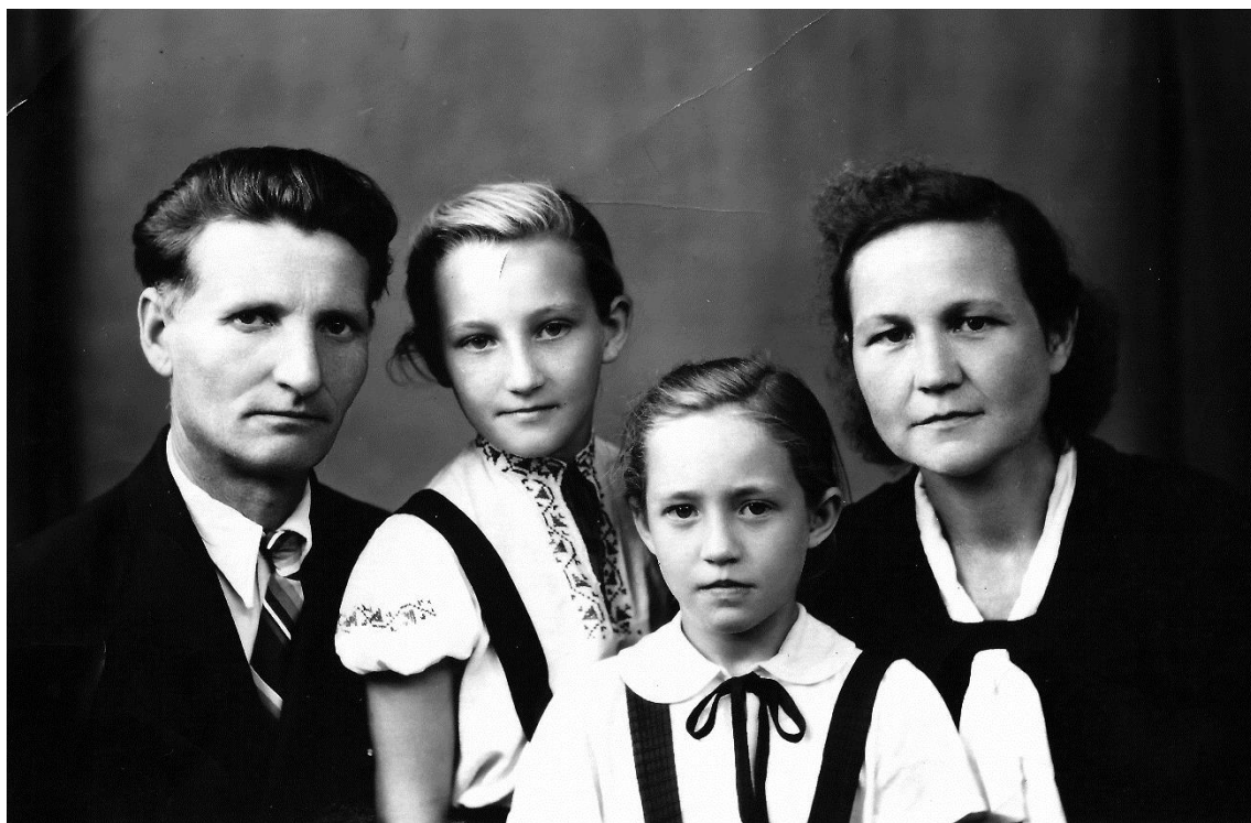
1957 г. Фото в г.Самаре.