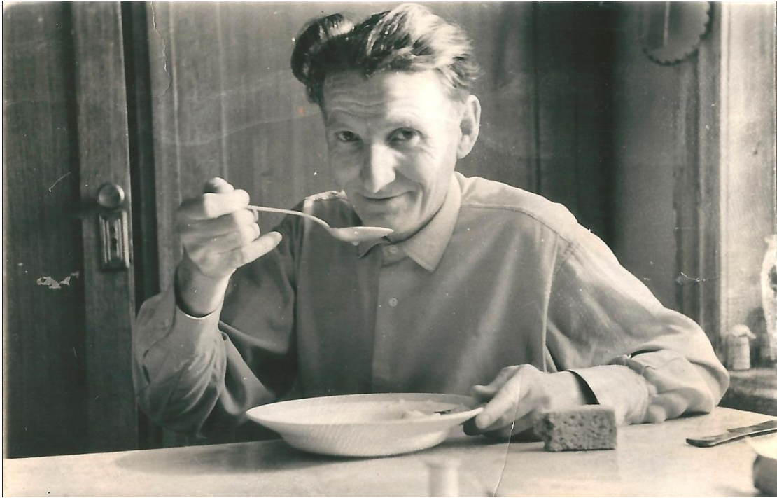
1968 г.