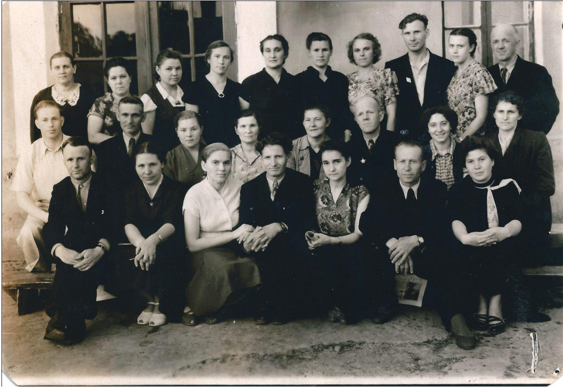
1963 г. Учительский коллектив